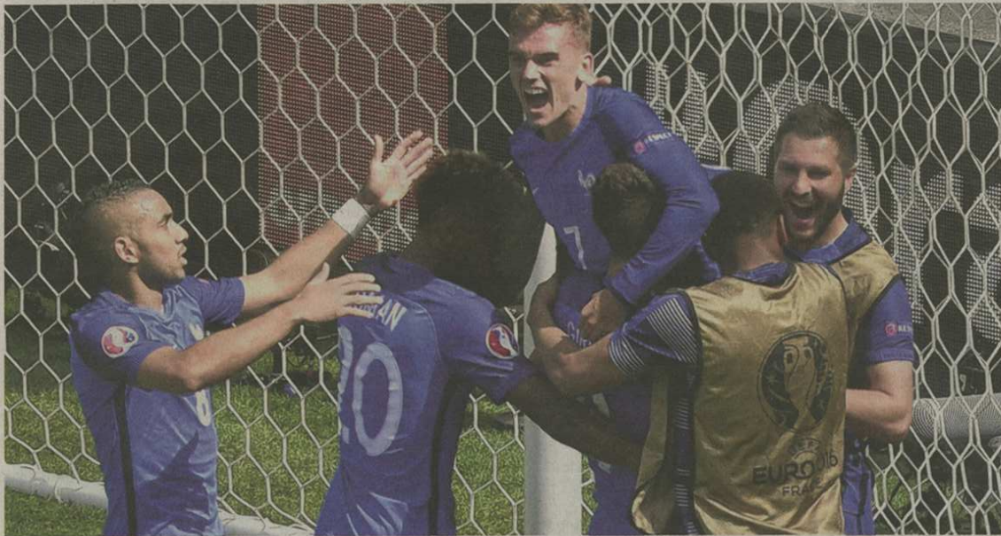
Mal partie face à l'Irlande, la France s'est finalement qualifiée pour les quarts de finale de l'Euro grâce à un doublé de Griezmann (2-1).

TOURS Le préfet à la rencontre des musulmans